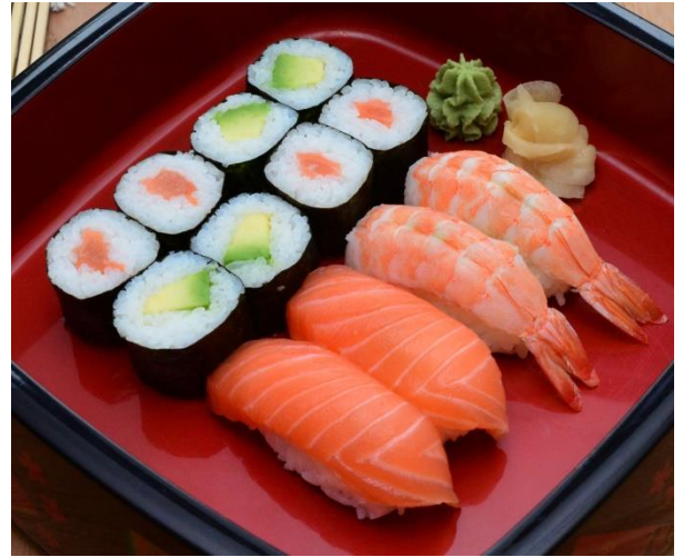
S2. Favorite – Set 20,00 € 4x Sake-Maki, 4x Avocado-Maki, 2x Sake-Nigiri, 2x Ebi-Nigiri