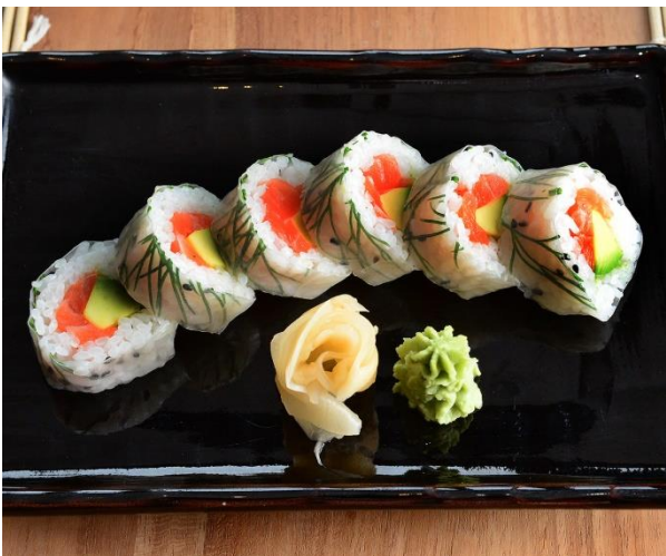
Bânôï – Roll 6 Stück 13,00 € Reis in Reisblättern mit Avocado-Sake-Dill, leicht scharf