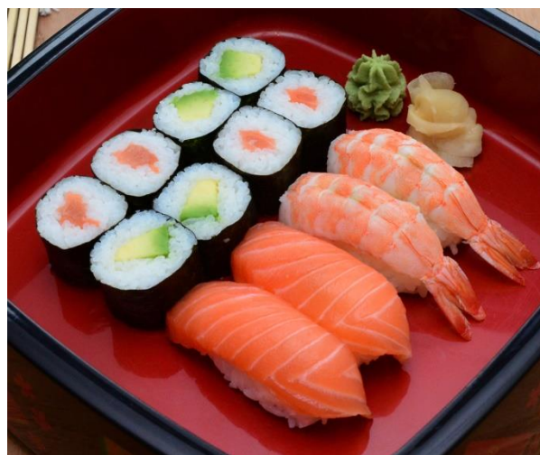
S2. Favorite – Set 16,00 € 4x Sake-Maki, 4x Avocado-Maki, 2x Sake-Nigiri, 2x Ebi-Nigiri