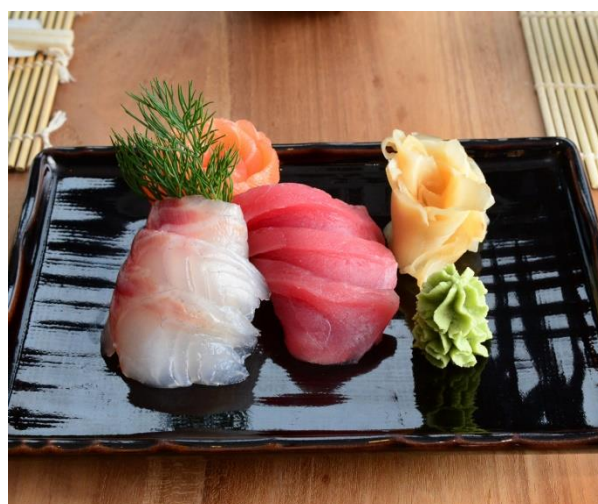
Sashimi 18,00 € mit drei verschiedenen Fischarten, je 2 Scheiben