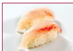
Suzuki oder Tai (Seebarsch oder Schnapper) - nach Saison -