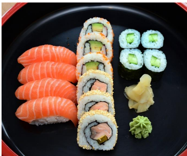
S3. Business – Set 19,00 € 4x Kappa-Maki, 3x California Roll, 3x Shio-Sake-Roll, 4x Sake-Nigiri