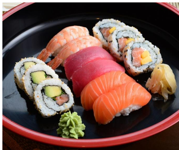
S5. Klassic – Set 23,00 € 2x Ebi, 2x Sake, 2x Maguro, 3x Saigon-Roll, 3x Sake-Avocado-Minz-Roll