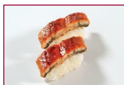
Unagi (gegrillter Aal)