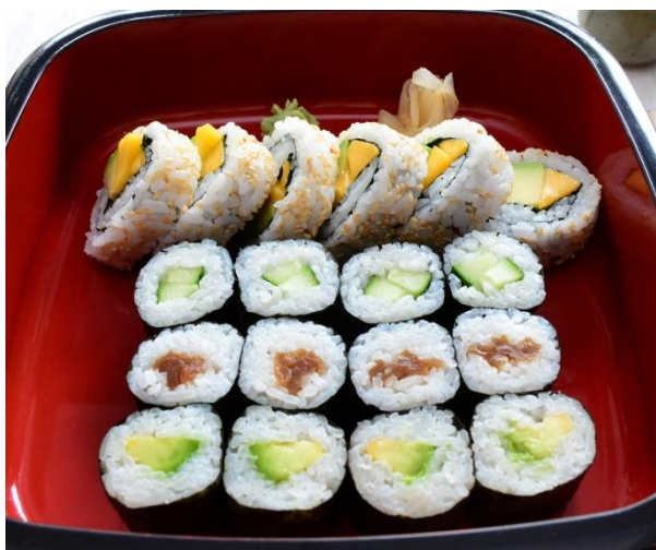
S1. Veggie-Mix 3 14,00 € 4x Avocado-Maki, 4x Kampo-Maki, 4x Kappa-Maki, 6x Avocado-Mango-Minz-Roll